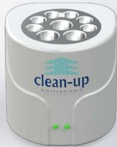
Incubadora Biológica Mini-Clean - Vapor