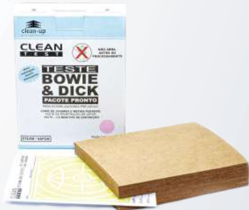
Bowie & Dick Pacote Pronto Versão Clássica