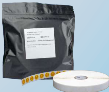
Indicador Químico Circular Radiação (Gamma and E-beam) Tipo 1