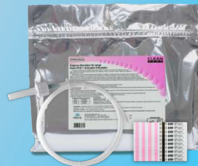
Sistema Liberador de carga Helix PCD + Indicador Emulador Tipo 6

Ref: 882 25 und Ref: 881 50 und Ref: 880 100 und Ref: 878 250 und