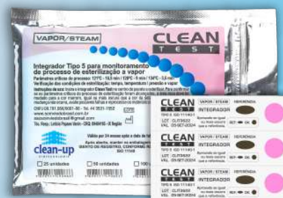
Integrador Químico para Vapor Tipo 5 - Tiras

Ref: 877 25 und Ref: 876 50 und Ref: 875 100 und Ref: 874 250 und