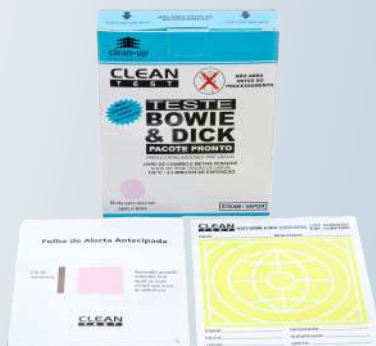
Bowie & Dick Pacote Pronto Versão Folha Alerta