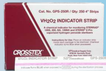
Indicador Químico para Peróxido de Hidrogênio (VH2O2) - Tipo 4