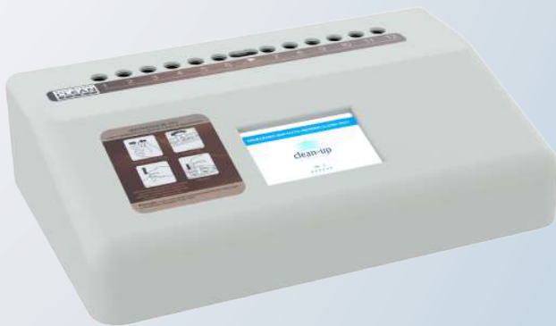
Incubadora Auto Reader CleanTest - Vapor