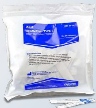
Integrador Químico para Vapor Tipo 5 - Pastilha

Ref: 877 25 und Ref: 876 50 und Ref: 875 100 und Ref: 874 250 und