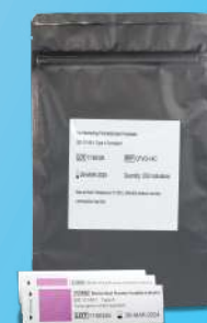
Indicador Químico Formaldeído - Tipo 4