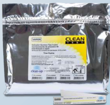
Indicador Químico Multi-Paramétrico para Vapor Tipo 4

Ref: 933 25 und Ref: 934 50 und Ref: 935 100 und Ref: 936 250 und