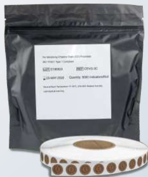
Indicador Químico Circular Óxido de Etileno (EO) - Tipo 1