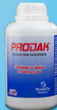
Fixador para Radiografia