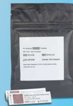
Integrador Químico Óxido de Etileno (EO) - Tipo 5