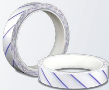
Fita adesiva para Peróxido de Hidrogênio (VH2O2) - Tipo 1