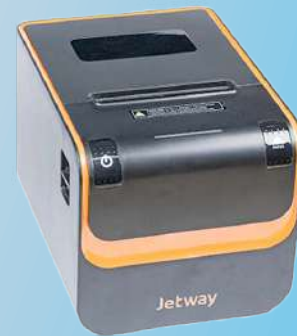
Impressora Térmica Jetway JP - 800