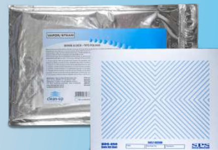
Bowie & Dick Tipo Folhas