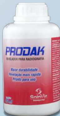
Revelador para Radiografia