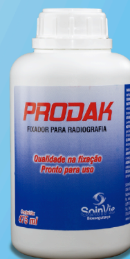
Fixador para Radiografia