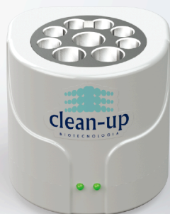
Incubadora Biológica Mini-Clean Plus - Vapor

6 Cavidades - Ref: 458 9 Cavidades - Ref: 1706