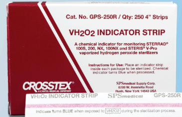
Indicador Químico para Peróxido de Hidrogênio (VH 2 O 2 ) - Tipo 1