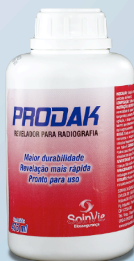
Revelador para Radiografia