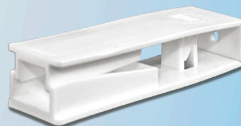
Quebrador de Ampolas

6 Cavidades - Ref: 458 9 Cavidades - Ref: 1706