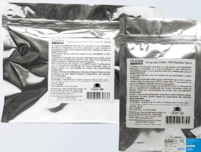
Integrador Químico para Vapor Tipo 5 - Pastilha

Ref: 1719 25 und Ref: 1720 50 und Ref: 1721 100 und Ref: 1722 250 und