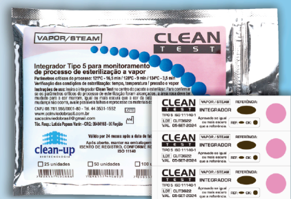
Integrador Químico para Vapor Tipo 5 - Tiras

Ref: 1719 25 und Ref: 1720 50 und Ref: 1721 100 und Ref: 1722 250 und