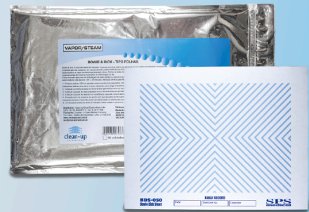
Bowie & Dick Tipo Folhas