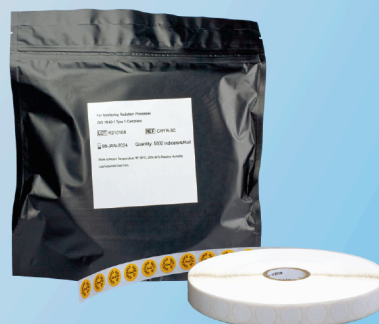
Indicador Químico Circular Radiação (Gamma and E-beam) Tipo 1