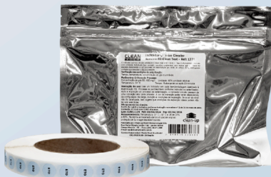
Indicador Químico Circular Adesivo Óxido de Etileno (EO) Clean Test - Tipo 1