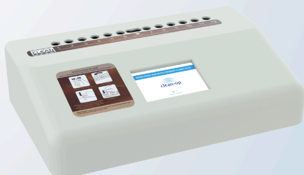
Incubadora Auto-Reader Clean Test - Vapor