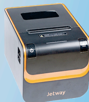
Impressora Térmica Jetway JP - 800