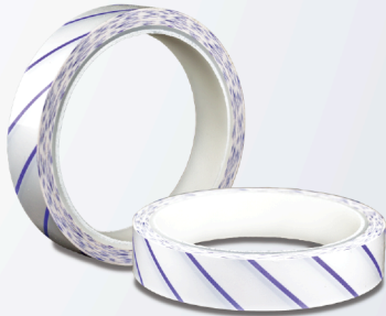
Fita adesiva para Peróxido de Hidrogênio (VH 2 O 2 ) - Tipo 1