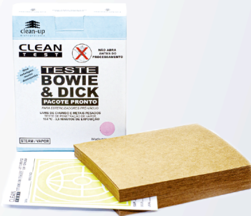
Bowie & Dick Pacote Pronto Versão Clássica